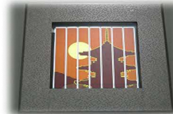
DSC製品「AKARIE」 シースルーの電池で日中に発電し、夜間に内蔵のLEDが電池表面の絵柄を照らし出す。

材料が安価であること、製造工程が簡便であること、意匠性(フィルム化、多色化)に富んでいることなどが特長。