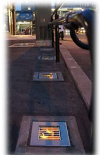
店舗入口の「AKARIE」 が優しい光で出迎える。 (横浜市内)