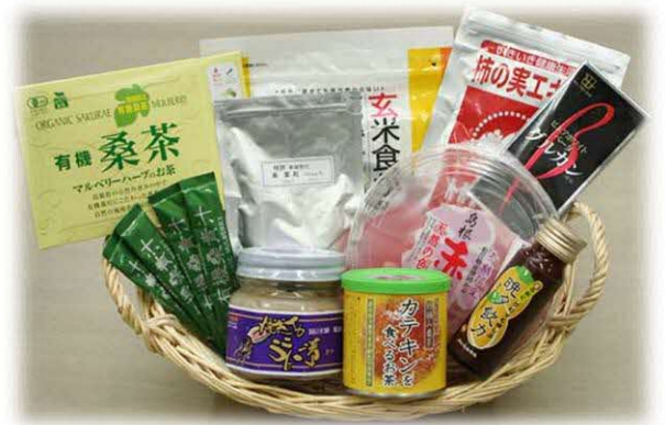
桑、柿などの商品化品目（一部）

さらに県内企業の商品開発、販路拡大、栽培、加工技術の向上に向けた取り組みを様々な角度から支援し、機能性食品産業群の育成を行った。