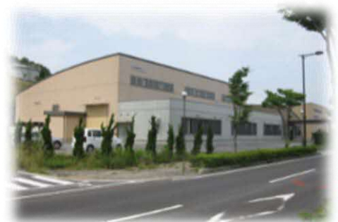
日立ツール(株)立地 (複合コーティング)