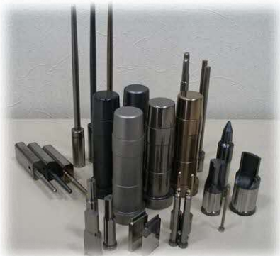
プラズマ熱処理適用事例 「Tribec」シリーズ

機械金属材料にプラズマ状態（電子が分子から離れ自由に動き回る状態）を利用して炭素や窒素を浸入させ、その材料の表面の強度や長寿命化を図るなど、プラズマ技術による工業製品の高機能化・高付加価値化を図った。